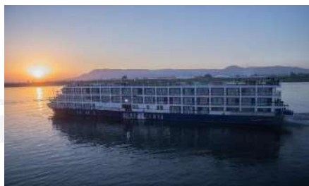
CRUCERO ROYAL ADVENTURE HTL. PYRAMIDS RESORT BY JAZ