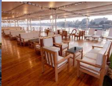
CRUCERO KING TUT I