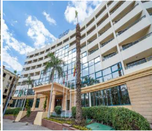
HTL AZAL PYRAMIDS