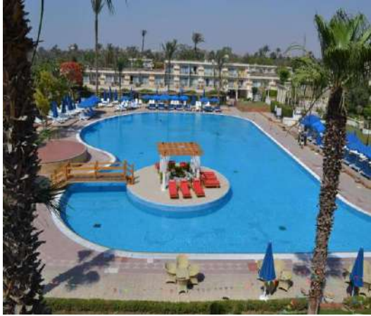
HTL. PYRAMIDS PARK