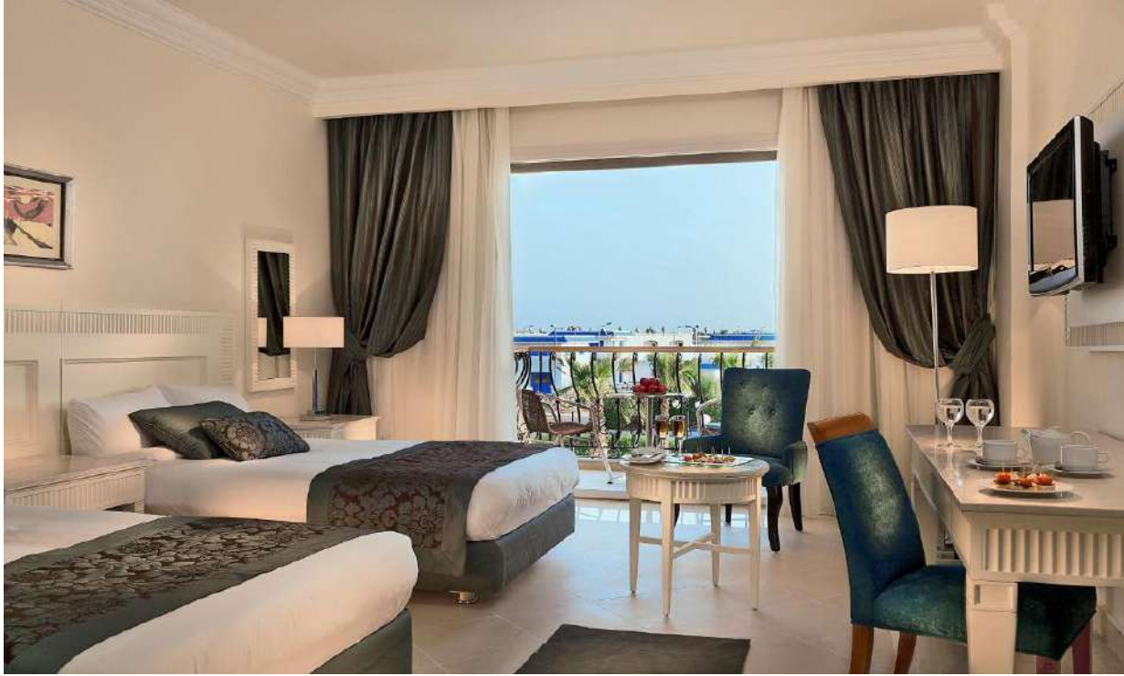
HTL IL MERCATO HOTEL & SPA