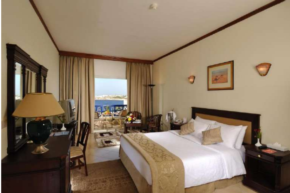
HTL GRAND OASIS RESORT